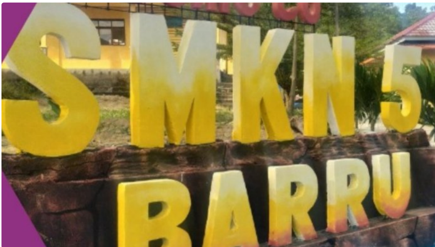
SMKN 5 Barru jl. Bawasalo no. 1 Lampoko, Kabupaten Barru, Provinsi Sulawesi Selatan

BARRU- Sekolah Menengah Kejuruan Negeri 5 Barru buka Penerimaan Peserta Didik Baru (PPDB) Tahun 2023/2024.